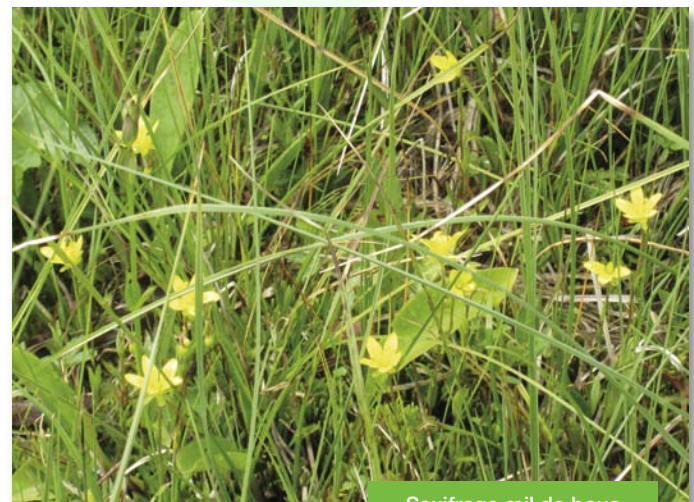
Saxifrage œil de bouc

http://www.developpement-durable.gouv.fr/-Flore-.html