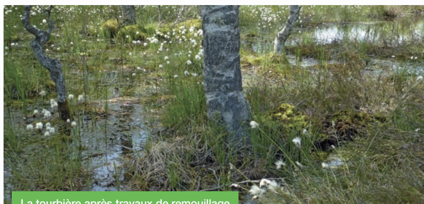
La tourbière après travaux de remouillage