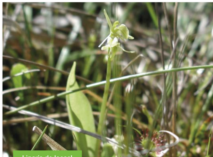
Liparis de loesel

Les habitats des zones humides ont été parmi les plus impactés dans les dernières décennies. Il n'est donc pas surprenant que deux espèces typiques des tourbières soient particulièrement menacées et fassent donc l'objet de plans nationaux : le Liparis de loesel et la Saxifrage œil de bouc. Si les populations restent viables à l'échelle nationale pour la première, il ne reste plus qu'un seul site français pour la seconde. La Saxifrage œil de bouc se maintient uniquement dans le bassin du Drugeon, dans des conditions hydrologiques qu'il convient d'étudier plus finement afin de préserver, voire d'augmenter cette population relictuelle et donc précieuse pour la biodiversité française.